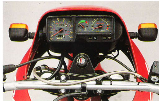
Particolare cruscotto completo di contagiri elettronico, tachimetro, contachilometri parz.- totale, temp. H 2 O, e spie indicazioni