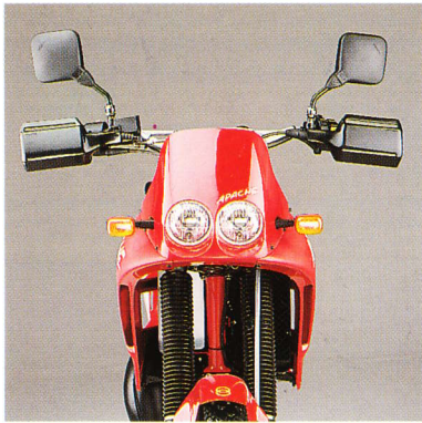
Vista anteriore cupolino, bifari, paramani