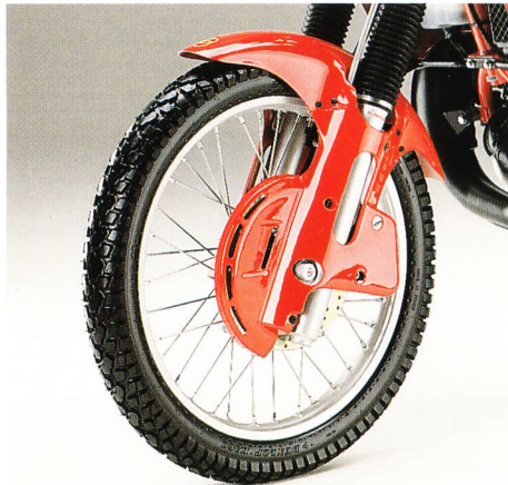
Particolare ruota anteriore con copridisco e copripinza avvolgente